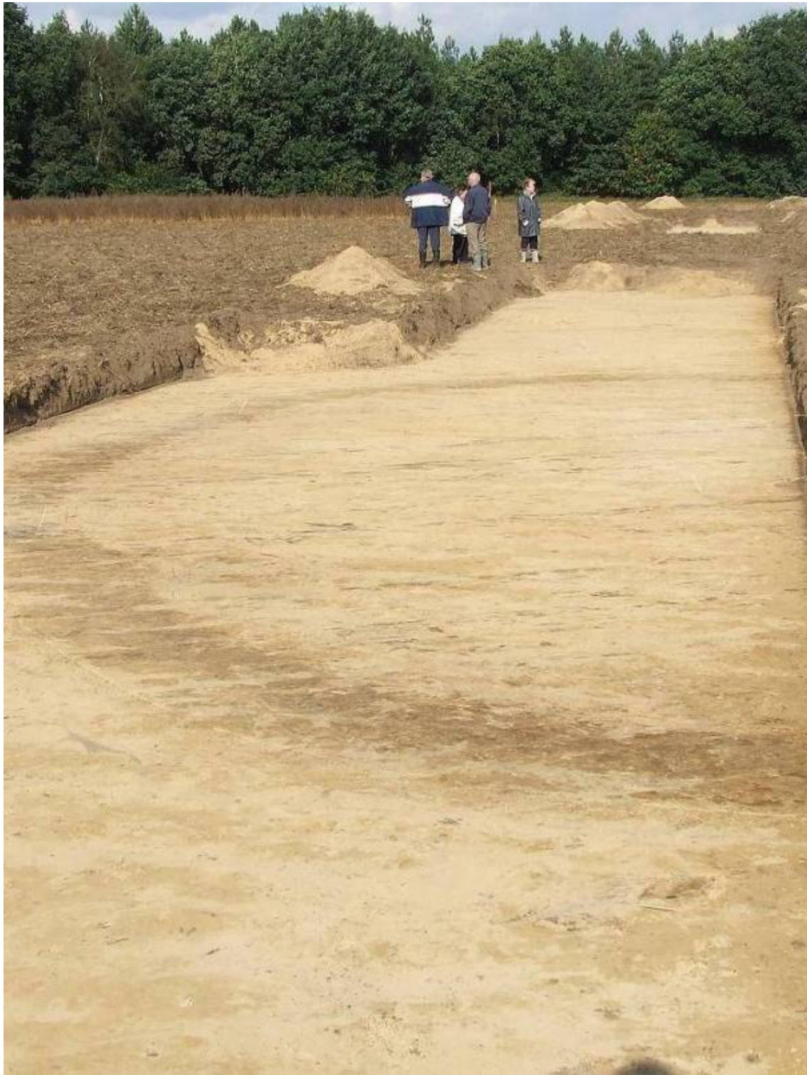
Greenpark-Floriade: kringgreppel van een grafheuvel uit de IJzertijd (800-50 v.Chr.)