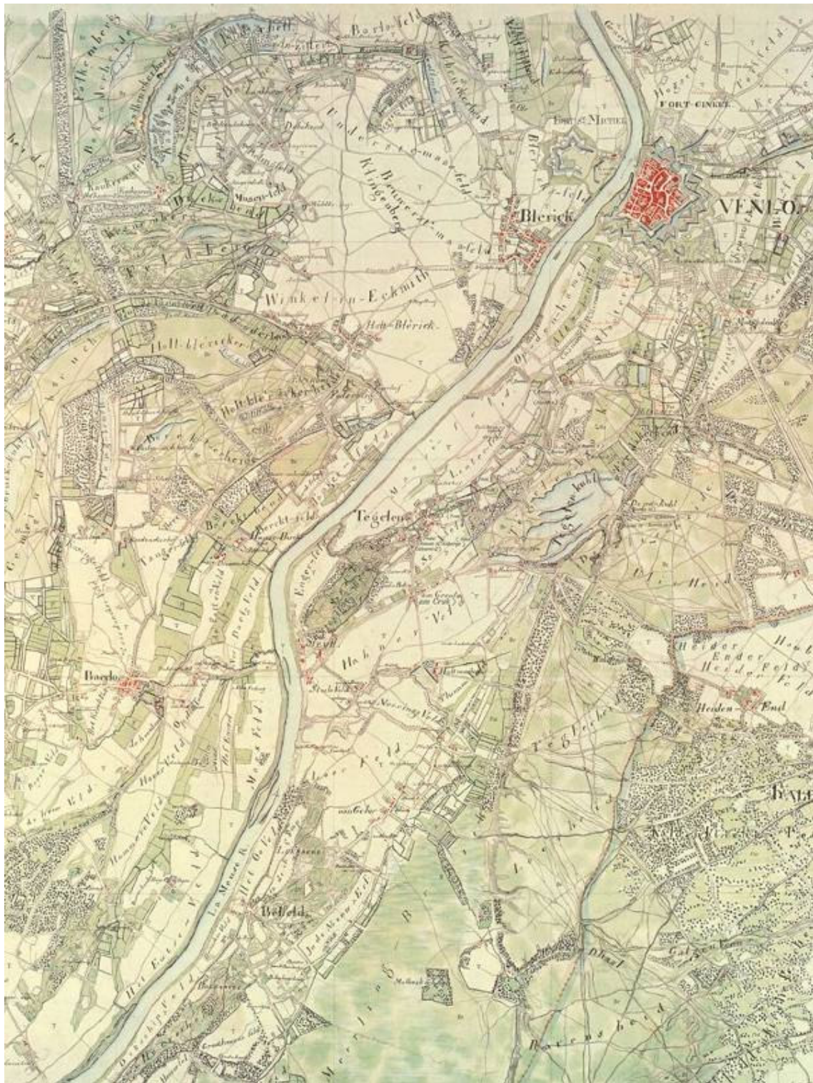
Het Maasterrassenlandschap rondom Venlo, Blerick, Tegelen, Steyl en Belfeld in 1806