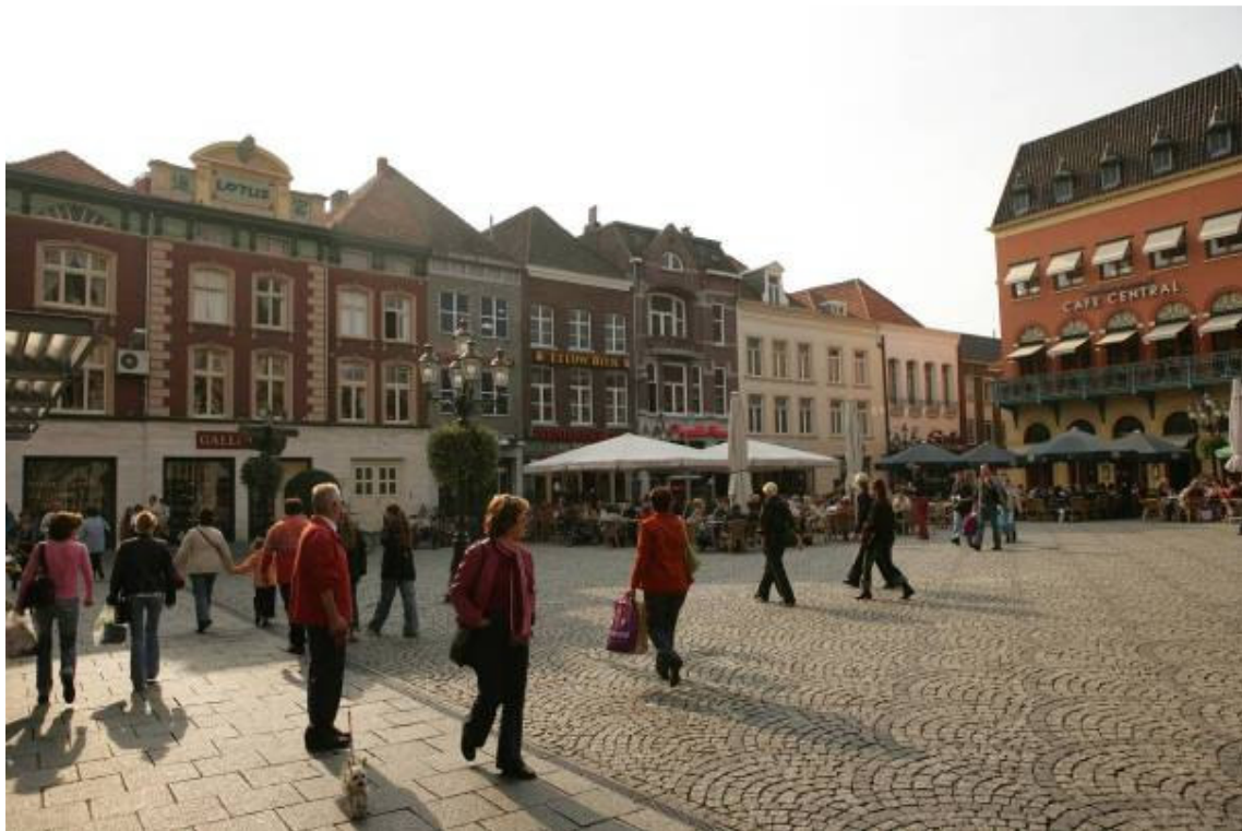
Gaaf bewaard gebleven middeleeuwse panden met jongere gevels aan de Markt in Venlo zijn een aantrekkelijk decor voor het vrijetijdstoerisme in de stad