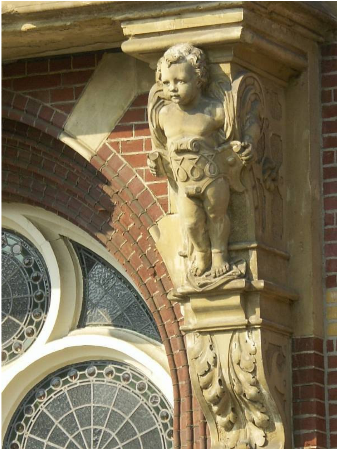
Monumenten zijn beeldragers van de Venlose identiteit