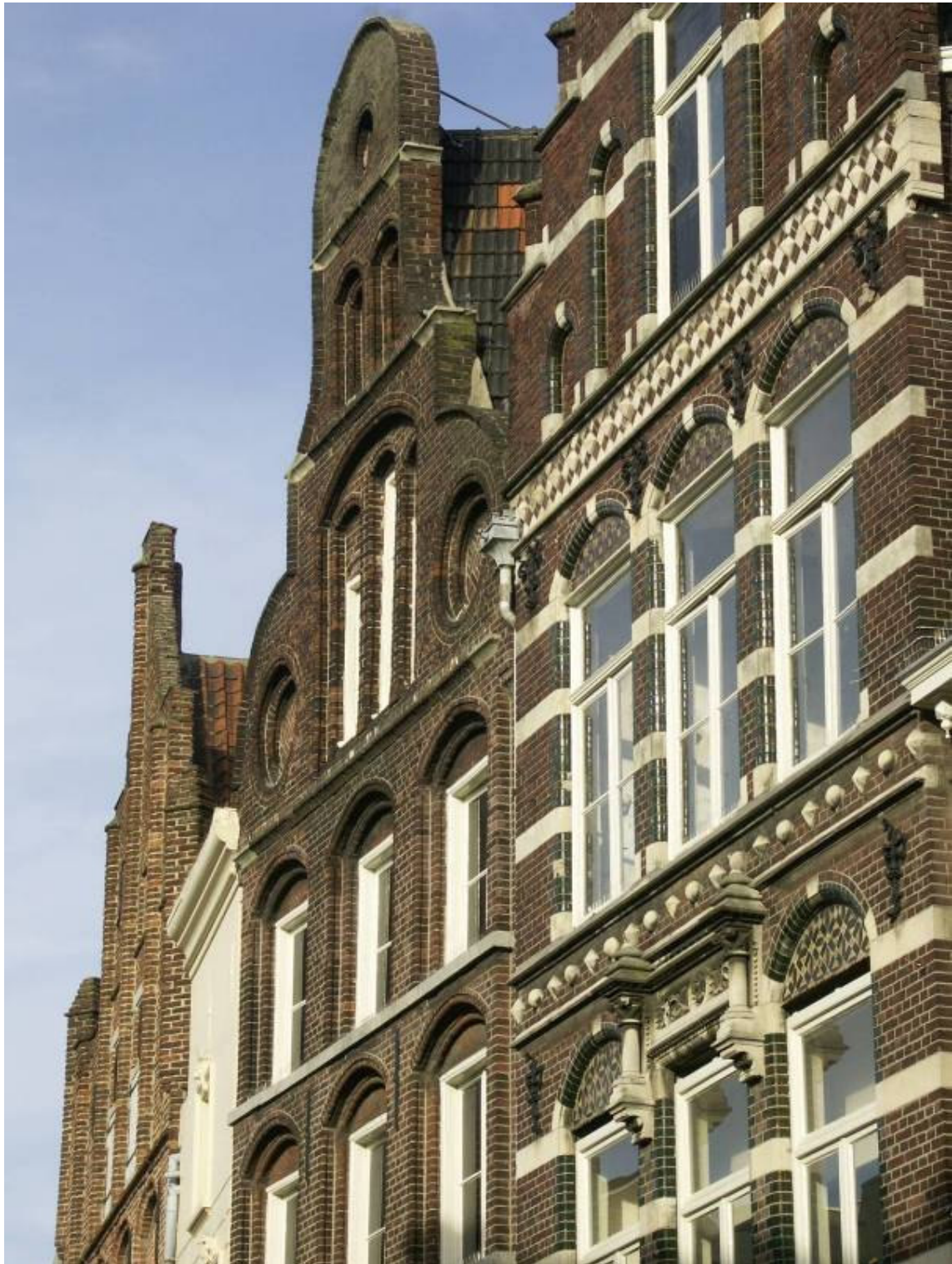
Middeleeuwse huizen met in de 19 e en 20 e eeuw vernieuwde en gerestaureerde gevels in de Vleesstraat