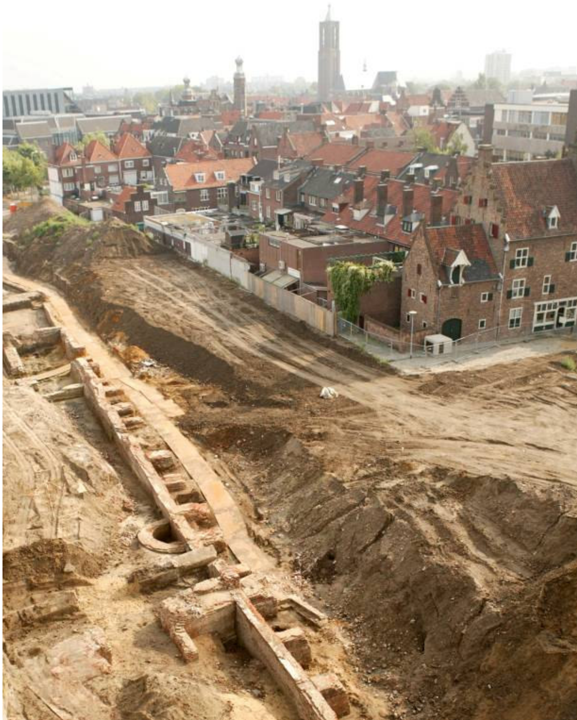
14e-eeuwse stadsmuur aan de Maasboulevard