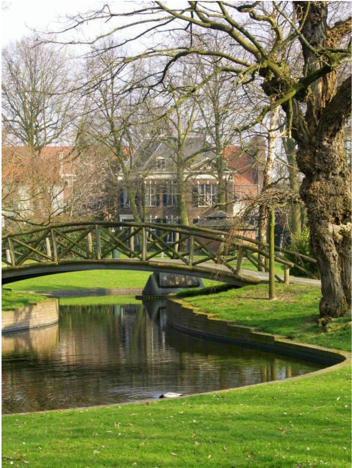
Monumenten in een waardevolle stedenbouwkundige context: Wilhelminapark Venlo