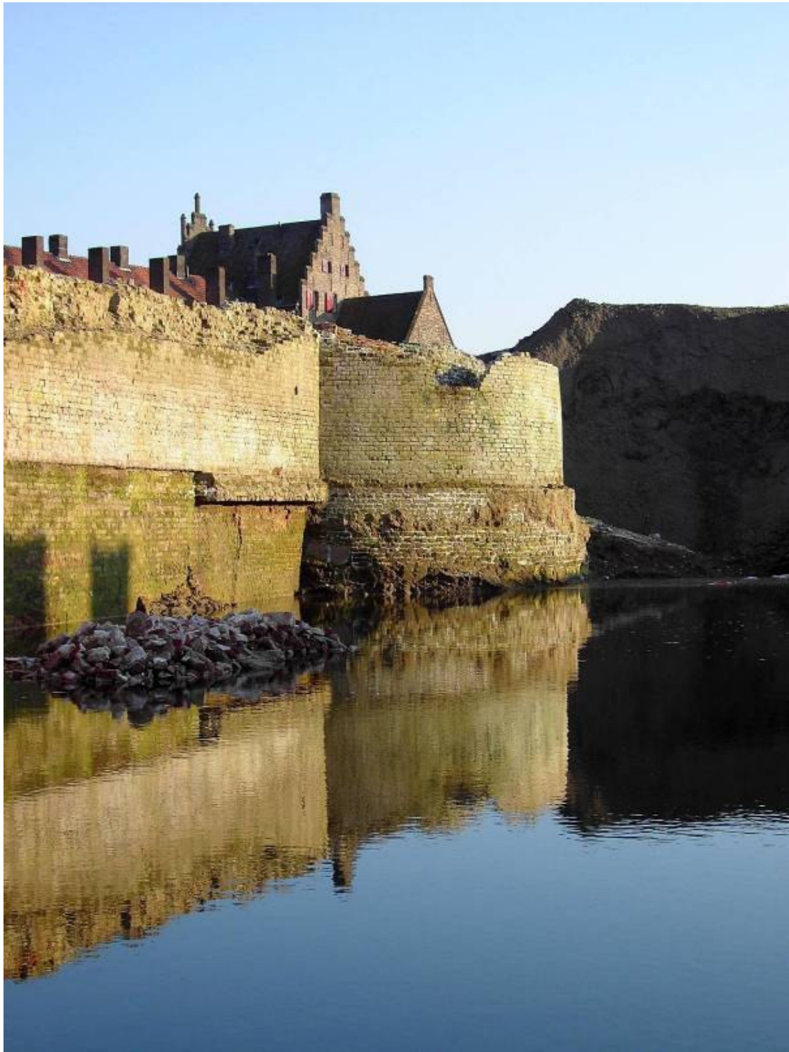
Maasboulevard anno 2004