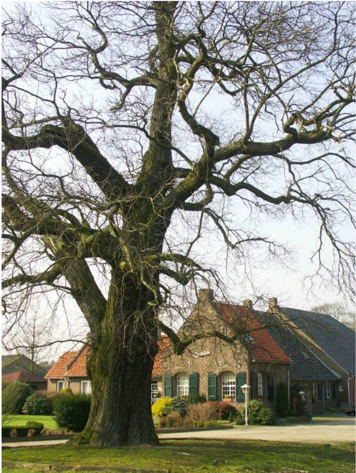
Cultuurhistorisch waardevolle context: monumentale bebouwing en erfaanleg van Gasthuishof (1654) nabij Ulingsheide